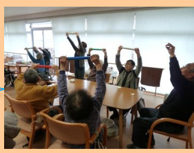
腕を上げて棒体操、頑張ってます