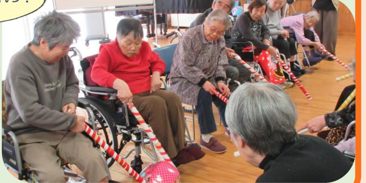
右：棒サッカーの様子 上、左：玉入れゲームの様子