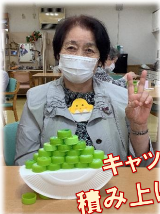
キャップ 積み上げレク