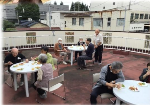
テラスで ビアガーデン