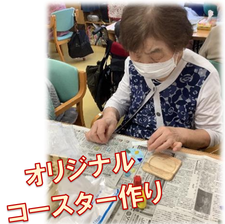
オリジナル コースター作り