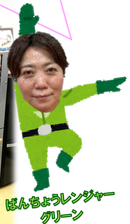
ばんちょうレンジャー グリーン