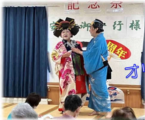
スタッフ オリジナル演劇

もし、ばんちょうで広めたいゲーム、趣味活動などございましたら、道具等もこちらで準備いたします。