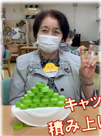
キャップ 積み上げレク