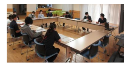
委員会内研修の様子

受診を伴う事故は10月末まで毎年10~15件発生していますが、R5年度は5件と件数減となっております。引き続き防げる事故を無くし、安全に生活していただけるよう職員一同取り組んでまいります。