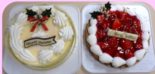
白石食品さんから頂いたケーキ