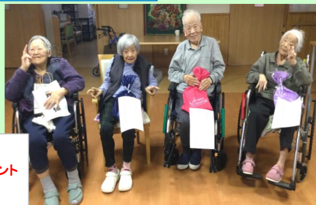
杜6丁目 12月お誕生会イベント 釣り大会