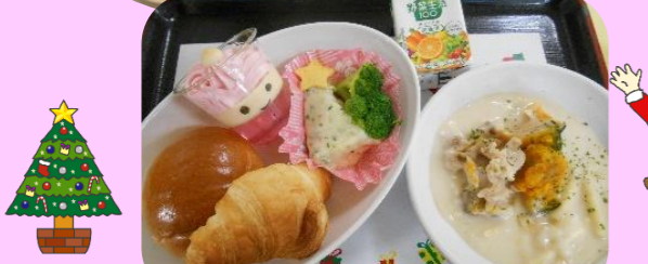
クリスマスのお昼のメニュー