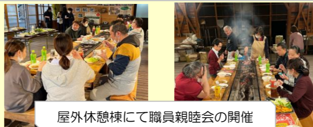
屋外休憩棟にて職員親睦会の開催

働きやすい職場環境づくりを心がけ、年間を通して様々な活動を行っております。今回はその一部を紹介させていただきます。