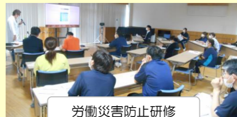
労働災害防止研修