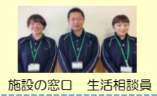
施設の窓口 生活相談員

家族の認知症が進んだり、常時身体介護が必要になり、自宅での介護に困難を感じている方、お困りの場合、ぜひご相談ください。相談内容を詳しくお聞きし、特養やショートステイ入居の説明や訪問看護、デイサービスをはじめ、地域の福祉サービスやSGグループの医療・福祉のネットワークと連携しご家族をしっかりサポートします。