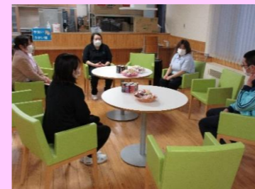
おしゃべり場の様子

権利擁護委員会は、身体拘束の廃止と利用者の尊厳と主体性を尊重し、身体的・精神的弊害を理解しながら、権利擁護の視点をもつ事を目的として活動しております。また委員会内では虐待防止委員会を設け、毎月虐待防止に向けた活動や、権利擁護に係る内部研修の開催や、虐待防止の観点から年に数回「おしゃべり場」を開催し職員同士の介護ストレスを分かち合いながら活動しております。