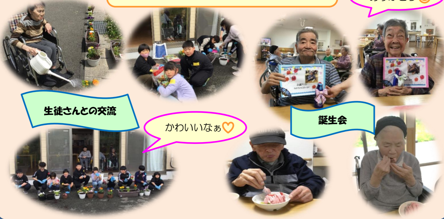
生徒さんとの交流