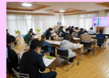
権利擁護研修の様子