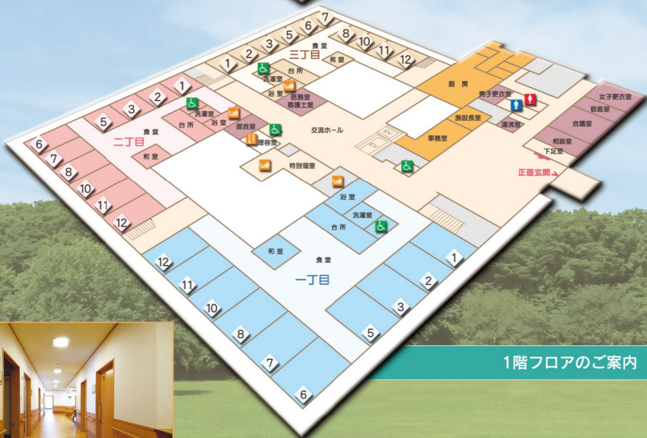
1階フロアのご案内