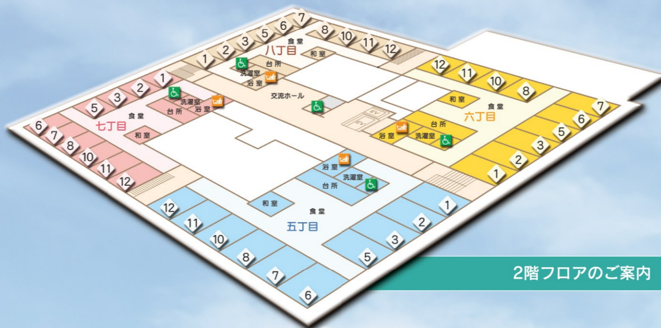
2階フロアのご案内