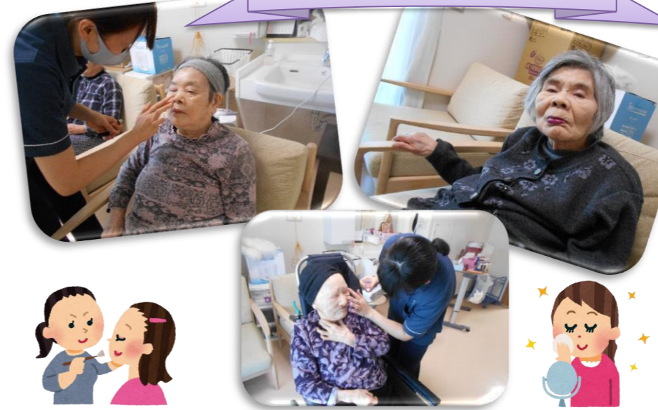
お化粧をして気分転換♪

◇10月18日、3・5丁目合同で誕生日会を行いました。職員や他利用者様より誕生日を迎えた4名の利用者様に歌を歌うなどしてお祝いしました。誕生日を迎えられた利用者様は「ありがとうございます」と感謝の言葉を述べられ嬉しそうなお姿でした。