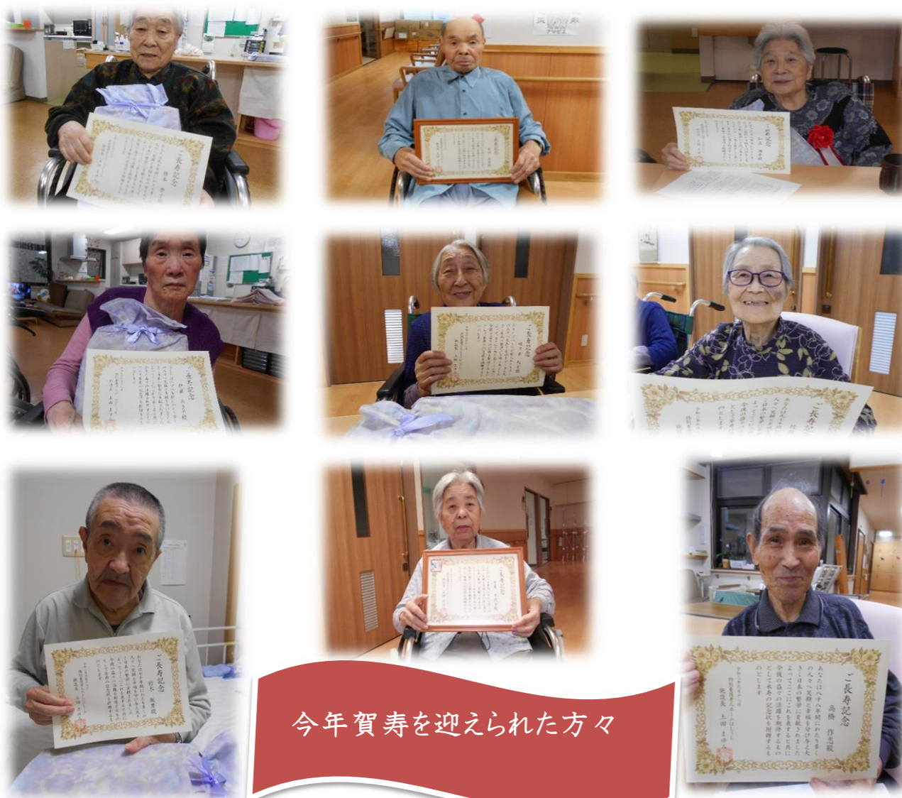
今年賀寿を迎えられた方々