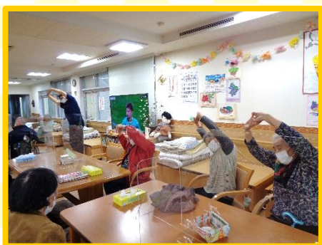
帰る前に体操を行っています。