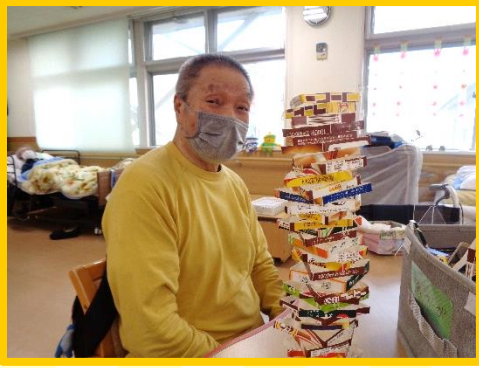
上手に重ねることが出来ました。