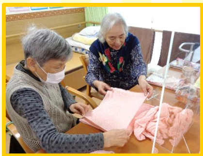
タオルたたみを協力して手伝って下さいました。