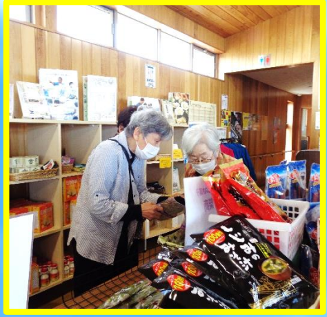
仲の良い方同士で一 緒に選んで買い物をさ れていました。