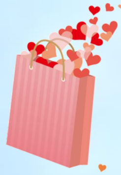
関上のメイフル館で、 買い物を楽しまれていました。