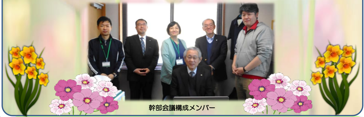
幹部会議構成メンバー