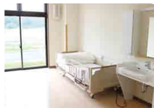
■明るく ゆったりとした居室