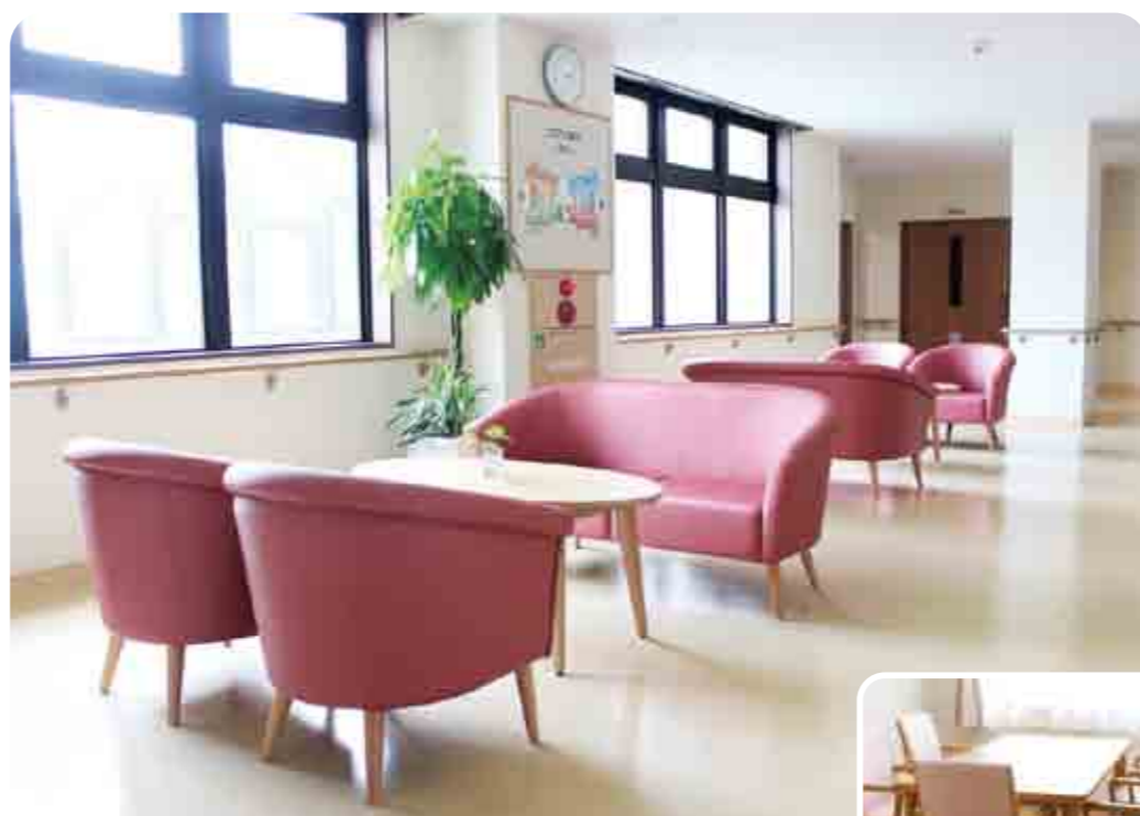
■自然光あふれるロビー

思いやりと笑顔をもって、 地域に根ざした「自分らしい生活」を過ごせるようお手伝いします。