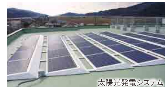
太陽光発電システム

特別養護老人ホームはしらは、石巻市より旧石巻市外では初めて「津波避難ビル」に認定されました(収容可能人数 1,519名)。