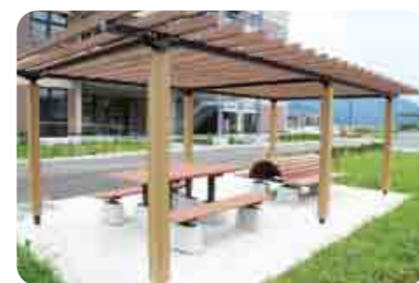
■リフレッシュスペース